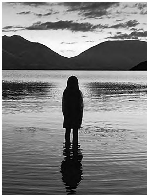
„The Top of Lake“, 2013.

vynias galybes serialų. Vienas paskutinių jo režisuotų serialų „Così fan tutte“ (2013) buvo kultūros kanalo Arte France , Idéale Audience , EuroArts Music , Teatro Real Madrid , Televisión Española (TVE) ir kitų bendras produktas. Mozarto operos televizinis serialas „Così fan tutte“ klasikinės muzikos portalo Intermezzo buvo pripažintas geriausiu metų kūrinium 24 .