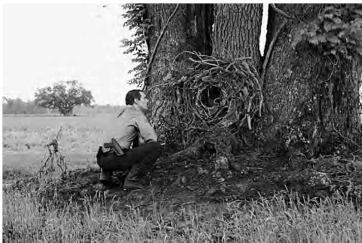
„Tikras detektyvas“. Matthew McConaughey, 2014.

Populiarioji kultūra mėgina keisti atminties stereotipus. Naujausi amerikiečių serialai „Hanibalas“ (2013), „Kultas“ [ The Following ] (2013), „Tikras detektyvas“ (2014) – ne tik puikių scenaristų, režisierių, aktorių sambūris, bet ir svarbių problemų apmąstymų, svarstymų ir sprendimų erdvė.